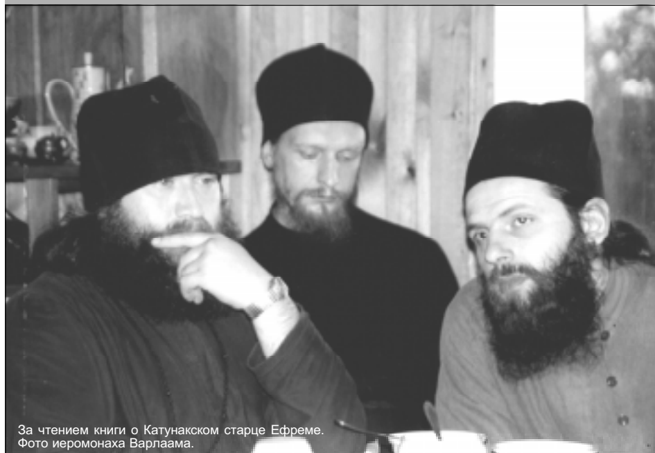
За чтением книги о Катунском старце Ефреме.

Будем читать отеческие книги и Божественное Писание. Нет свободного времени? Хотя бы полчаса каждый день читай. То очищение, просвещение, которое получишь будет, тебя поддерживать весь день и ночь.