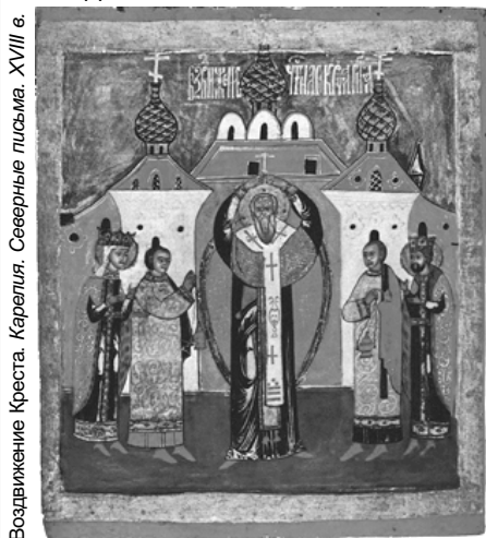
Воздвижение Креста. Карелия. Северные письма. XVIII в.

27 сентября — двенадцатый праздник Воздвижение Креста Господня.