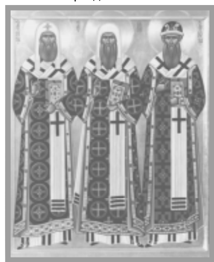
Свт. Петр, Алексий и Иона. Сийский монастырь. 2002 г.

В Антониево-Сийском монастыре, в храме Трех святителей Московских — Петра, Алексия и Ионы, — престольный праздник.